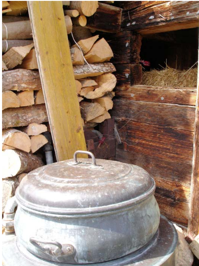
Stall beim Wohnhaus Prasten