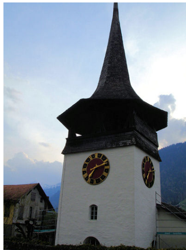
Die Kirche Reichenbach

Reichenbach liegt an sehr zentraler Lage in einem der schönsten voralpinen Gebiete der Schweiz. Die Kirche Reichenbach, erbaut 1484: Turmchor über quadratischem Grundriss mit hölzernem Glockengaden und 8-seitigem geknickten Holzdach. 1528 wurde Reichenbach zu einer selbständigen Kirchgemeinde erhoben.