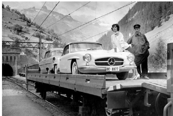
Autoverlad am Lötschberg (Goppenstein)

Nach dem Krieg erholte sich der Schweizer Tourismus verhältnismässig rasch und erlebte nach 1951 einen Aufschwung, der die kühnsten Prognosen übertraf. Ab 1973 setzte dann allerdings für drei Jahre ein kontinuierlicher Rückgang ein. Anfangs der 80er-Jahre wurde ein erneuter Aufschwung verzeichnet, der 1981 in einem neuen Rekordergebnis gipfelte. Rund 30 Jahre später befindet sich der Schweizer Tourismus in einer Welt, die ihr Gesicht rasant verändert hat; der Tourismus hat globale Züge angenommen und mit Einzug der neuen Informationstechnologien ist beinahe jedes touristische Angebot von zu Hause aus buchbar. Die Kunden sind informierter und sensibilisierter denn je und die touristische Schweiz steht in einem hart umkämpften internationalen Wettbewerb. Die Ergebnisse der letzten Jahre sind zwar positiv, doch die Herausforderungen der Zukunft sind auch in diesem Wirtschaftsbereich gross.