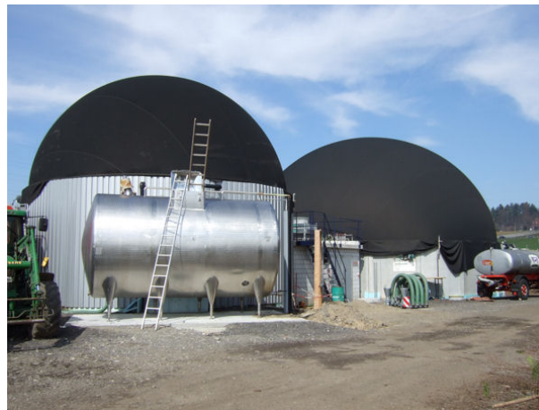
Biogasanlage in Ittigen bei Bern (Baujahr 2005)

Biogas aus Gülle; Strom- und Wärmeproduktion aus Biogas Leistung: Die Anlage erbringt eine elektrische Spitzenleistung von 340 Kilowatt und liefert Strom für über 300 Haushalte.